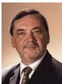
G. Jacques RÉGIS predsjednik IEC-a

IEC, ISO i ITU norme svjetskim vladama i gospodarstvu nude najbolja mjerila na koja se treba upućivati pri donošenju svih političkih odluka ili pri budućem sastavljanju sporazuma o klimi. Ove tri organizacije djeluju zajedno s drugim međunarodnim organizacijama kako bi osigurale da sudionici dolazeće Konferencije o klimatskim promjenama Ujedinjenih naroda, koja će se održati od 7. do 18. prosinca 2009. u Kopenhagenu, Danska, u potpunosti budu svjesni rješenja koja nude postojeće i buduće međunarodne norme.