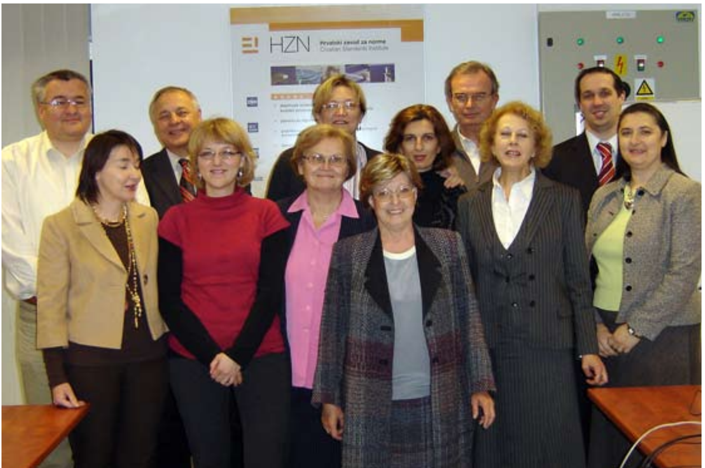
Radna skupina za izradu prijave za članstvo Hrvatskog zavoda za norme u CEN-u i CENELEC-u